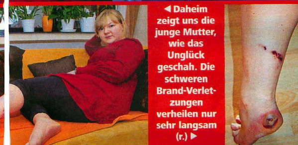
Daheim zeigt uns die junge Mutter, wie das Unglück geschah. Die schweren Brand-Verletzungen verheilen nur sehr langsam (r.)