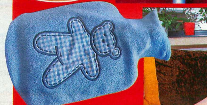
Nur ein dünner Stoffbezug umhüllte die kochend heiße Wärmflasche